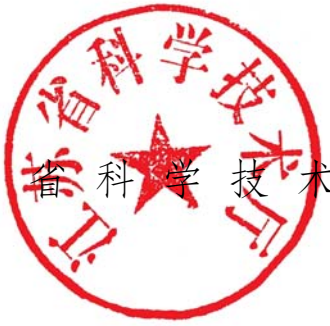
江苏省科学技术厅