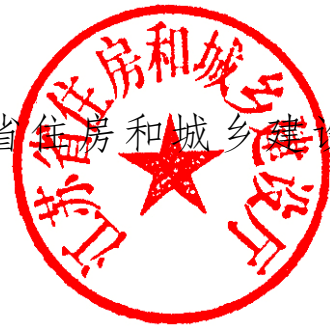
江苏省住房和城乡建设厅